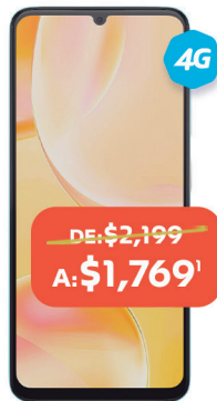
ZTE Blade A55 128GB