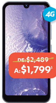
TECNOMOBILE POP 5S