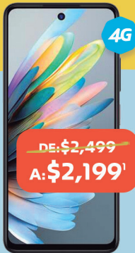
ZTE Blade V60 Smart