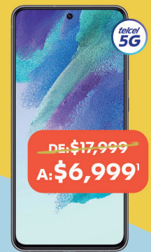
SAMSUNG Galaxy S21 FE 256GB