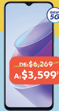
HONOR X8A 5G