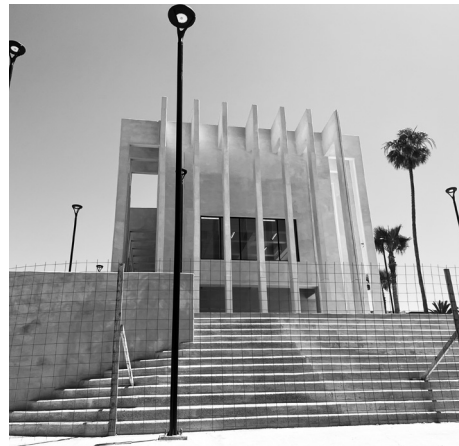
construcción del edificio del IMAC.

Precisó que en Volcanes y Caracoles la comunidad se organiza y el Ayuntamiento lleva los árboles para que sean plantados, por lo cual, esta actividad es bien recibida por la comunidad y esperan que siga siendo así, sobre todo el parque Abelardo L. Rodríguez, donde creció la indignación porque se dejaron secar las palmeras, árboles y la vegetación de las áreas verdes, tras la