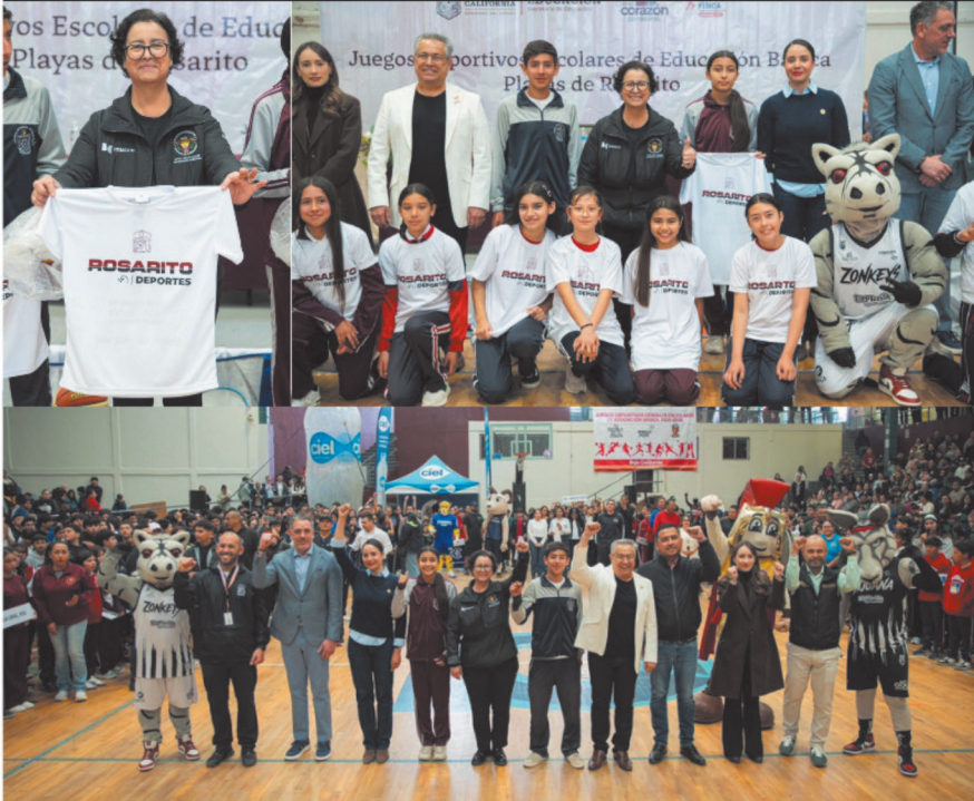
Playas de Rosarito, B.C., a 04 de marzo de 2026.

La presidenta municipal de Playas de Rosarito, Rocío Adame, encabezó la ceremonia de premiación de los Juegos Deportivos Escolares de Educación Básica 2025-2026, etapa municipal, realizada en la Unidad Deportiva "Ruffo Appel", donde se reconoció el talento y esfuerzo de niñas, niños y jóvenes participantes.