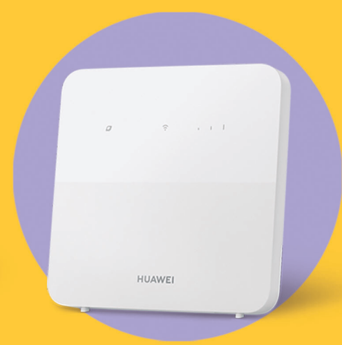
HUAWEI B320-523 CPE 5S