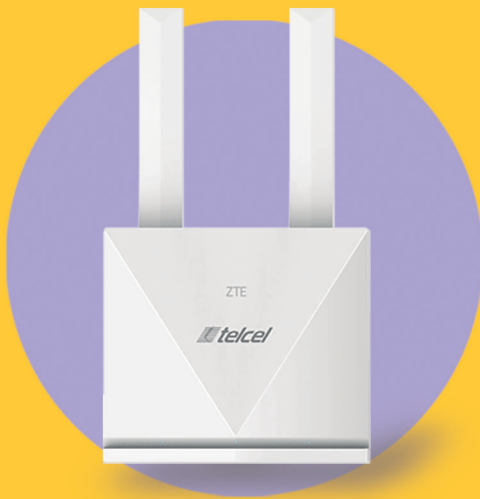
ZTE K10 MF295