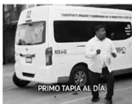
PRIMO TAPIA AL DÍA

Los mismo pasajeros comentan casos lamentosos, apenas el pasado martes, un ciudadano, expulsó un hecho muy penoso pues la chofer conocida como Columba lanzó un par de groserías a un pasajero cuando maneja la unidad por el Plan Libertador, así que el pasajero le aventó las monedas como si fueran piedras a la mujer. Pero este no es el único caso cabe recordar que hace semanas se viralizó un caso donde dos choferes de la ruta de Primo Tapia se agarran a golpes y patadas, un hecho patético pero lamentable, entre estos dos servidores públicos.