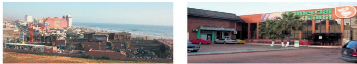
Foto 1 y 2. Quinta Plaza antes de ser destruida por los falsos administradores.