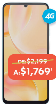
ZTE Blade A55 128GB