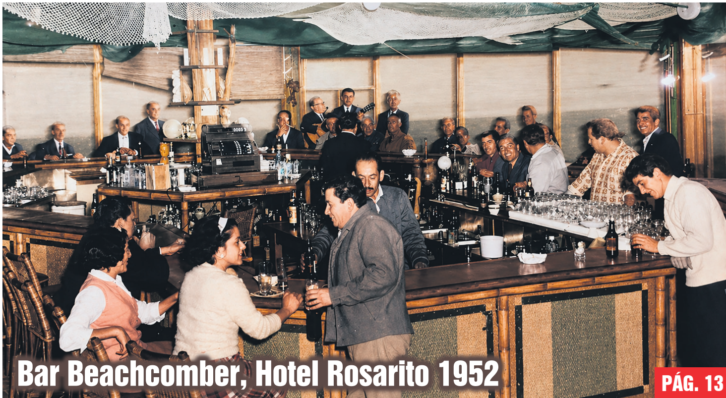
Bar Beachcomber, Hotel Rosarito 1952