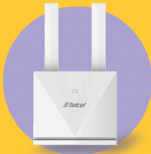
ZTE K10 MF295