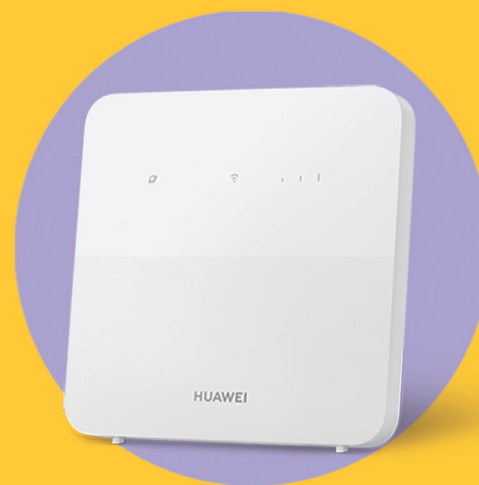
HUAWEI B320-523 CPE 5S