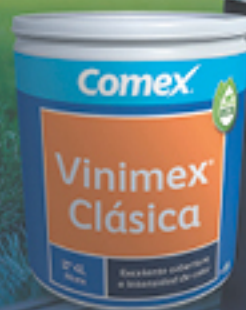
Jared Borgetti Leyenda Selección Nacional de México