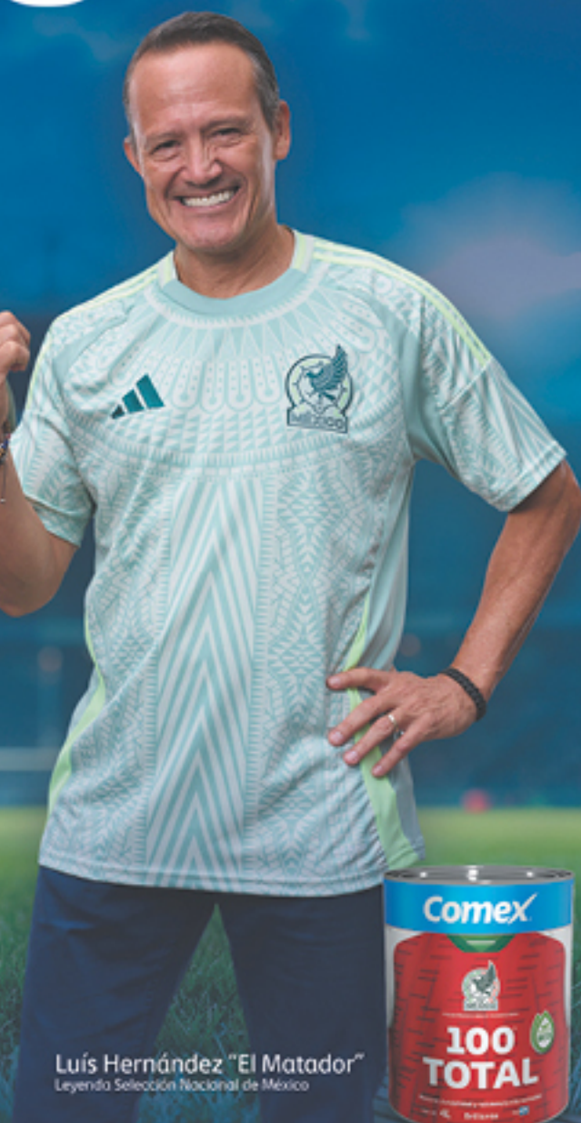
Luís Hernández "El Matador" Leyenda Selección Nacional de México