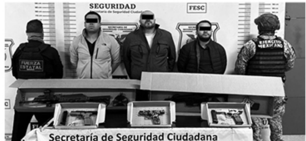
Secretaría de Seguridad Ciudadana

Los agentes consultaron a la FGE y confirmaron que el vehículo tenía el estatus de recuperado, dejando el reporte sin novedad.