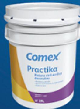
Practika® Cubeta 19 L