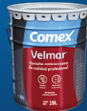
Velmar® Cubeta 19 L

Vigencia del 20 de mayo al 30 de junio de 2024.