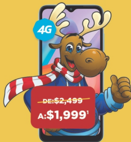
XIAOMI A2 64 GB