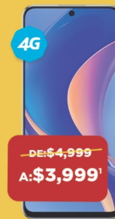
HUAWEI NOVA Y90