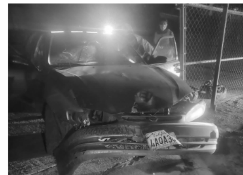
color negro, con placas de circulación 7DDX882 del estado de California.

No se reportaron detenidos, pero cerca del lugar fue encontrado abandonado, con las ventanas abajo y las llaves puestas, siendo este Nissan Sentra,