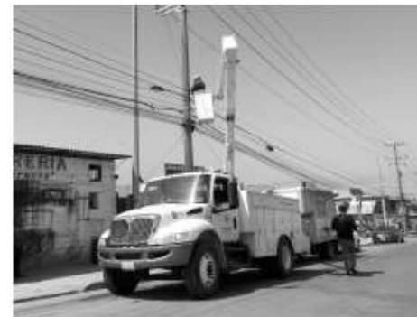
Programa Arc GIS, se tendrá más control de los aparatos y de los datos técnicos de cada uno de ellos.

El funcionario dijo las luminarias instaladas tendrán una vida útil de 10 años, garantizado por escrito ante un notario público, con un ahorro considerable en el pago del consumo. Con este nuevo sistema de digitalización del alumbrado en el