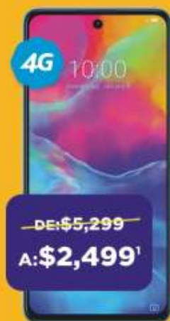
ZTE Blade V30