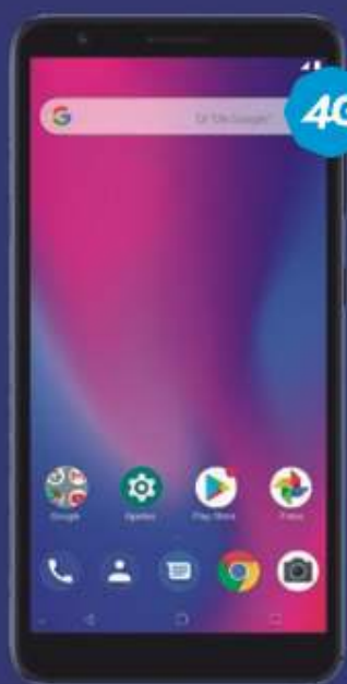
PLAN TELCEL PLUS 3