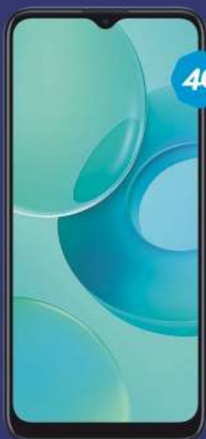
PLAN TELCEL PLUS 4