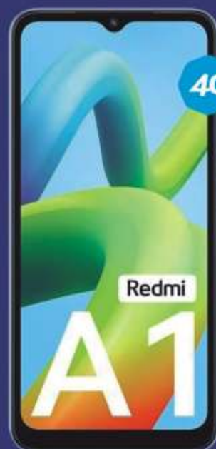
PLAN TELCEL PLUS 4