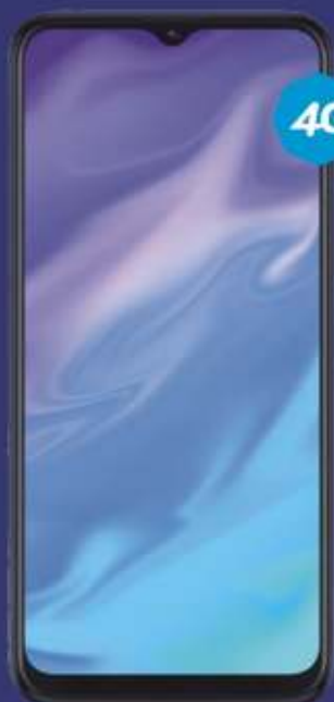
PLAN TELCEL PLUS 4