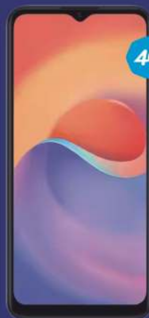
PLAN TELCEL PLUS 4