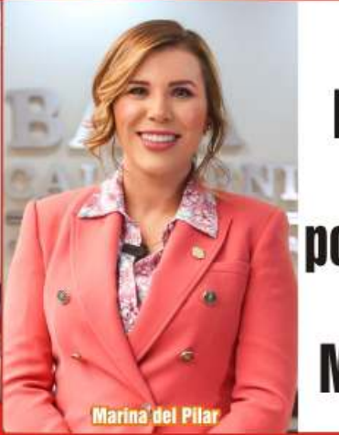
Marina del Pilar

Se consolida Baja California como una potencia turística en México: Marina del Pilar