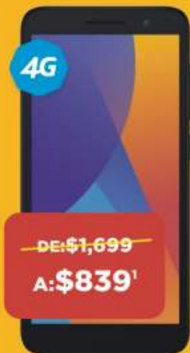
ALCATEL 5033M 1