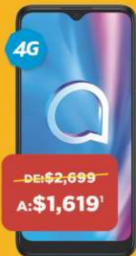
ALCATEL 5030A 1SE 64GB