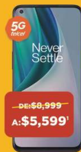
ONEPLUS NORD N10 5G