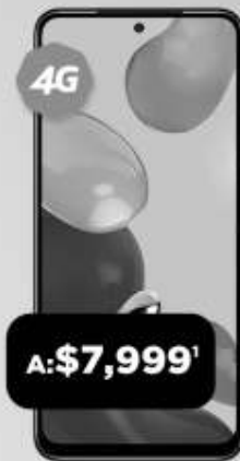
XIAOMI Note 11s