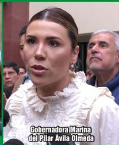
Governadora Marina del Pilar Ávila Olmeda

Lidera Baja California en la generación de empleo