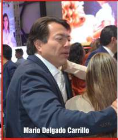
Mario Delgado Carrillo

Mario Delgado “Es Marina del Pilar un referente a nivel nacional”