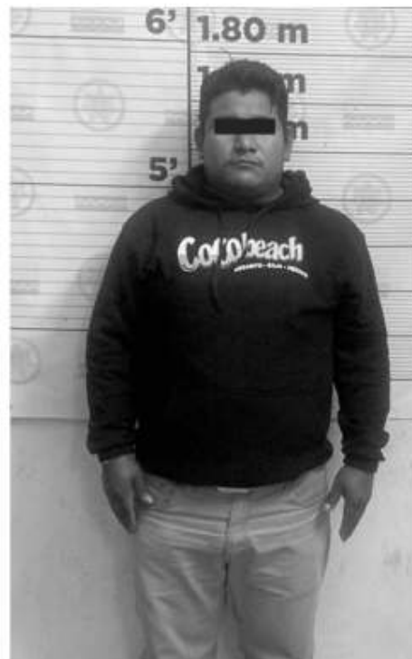
"N", de 25 años de edad.