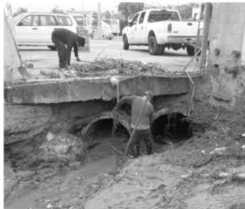
De acuerdo con el Director de Protección Civil y Bomberos, Aroldo

Después de los daños ocasionados en Baja California tras el remanente del pasado huracán, se dejó en claro la falta de infraestructura pluvial a nivel municipal, pues nuevamente ocurrieron encharcamientos e inundaciones en las principales vialidades de la ciudad.