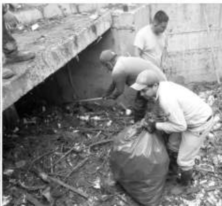
Rentería, se llevará a cabo un recorrido con la Secretaría de Desarrollo Urbano,

para realizar un diagnóstico en la infraestructura pluvial para detectar agrietamientos y fallas en la capacidad, y con este diagnóstico llevarlo a la autoridad Estatal y así solicitar recursos para su rehabilitación y prevenir inundaciones. El funcionario indicó que las afectaciones principales por encharcamientos e inundaciones se encuentran en el entronque del Bulevar Benito Juárez con el Bulevar Sharp, por los escurrimientos que llegan desde la parte alta de la colonia de la Benito Juárez; así como los escurrimientos que llegan hasta el arroyo Huahuatay.