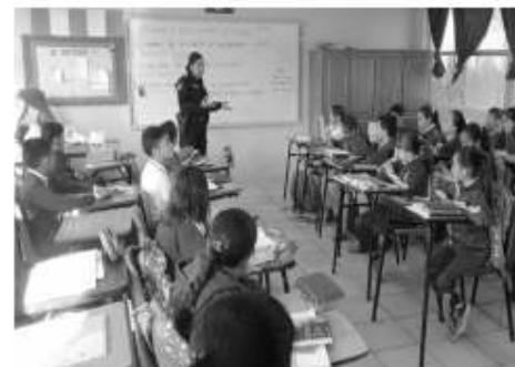
Finalmente, se realizó la graduación D.A.R.E. nivel secundaria en el colegio de las Américas del Fraccionamiento Villa Floresta.

De enero a junio del 2022, se han recuperado dos espacios públicos en Primo Tapia con el repintado de la mascota D.A.R.E. en dos bardas.