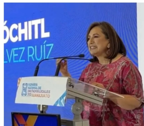
rosaritenses desilusionados del actual gobierno.

Finalmente, celebro que Xóchitl Gálvez haya decidido venir a Baja California y Rosarito a traer ese mensaje y deseo de cambio que demandan los