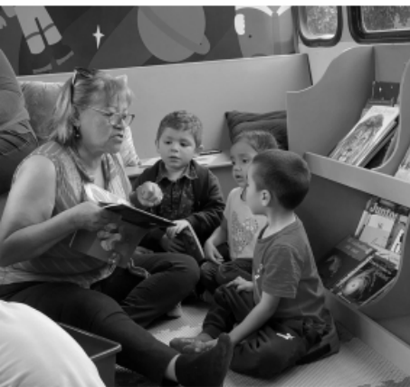
Por Delia Ruelas

El proyecto denominado Bibliobús busca llevar educación y acercar el acervo infantil a las colonias vulnerables o alejadas de la mancha urbana, así también el denominado Papalote bus lúdico, es un camión con actividades sensoriales en donde se le da atención a niños con problemas del aprendizaje, trastornos del desarrollo, problemas cognitivos, problemas del habla, se atiende a niños con discapacidad motriz, ambos camiones tienen un enfoque de atención integral para los infantes.