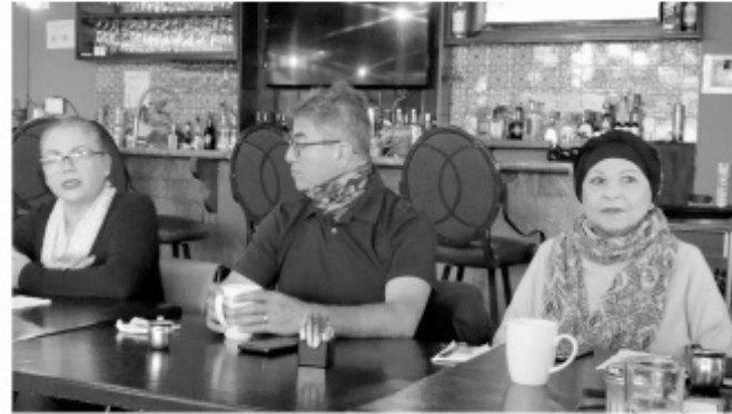
Partido Encuentro Social (PES).

sábado 21 de octubre, el punto de partida es sobre el Bulevar Benito Juárez a la altura del Hotel Rosarito hasta llegar a los linderos de la Plaza San Fernando. Será una convivencia sana y recreativa, además de que a los primeros asistentes se les obsequiará algún premio o reconocimiento en especie, expresaron directivos del