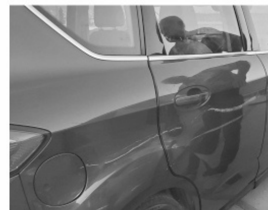
Era una marca con gis el supuesto roce de vehículo con el montachoque

Lo recomendable es llamar de manera inmediata a la compañía de seguro, en caso de no tener seguro llamar al 911,