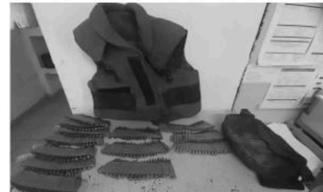
disposición de la Fiscalía General de la Republica.