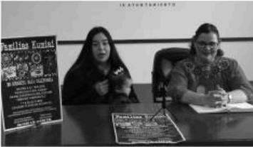
Por Delia Ruelas

Durante el evento participarán familias de las etnias Paipai, Cucapá, Kiliwa, Cochimi, y familias Yumanas, que darán una muestra de su cultura y gastronomía, por lo cual, el evento se desarrollará en una convivencia donde habrá canto, danza, artesanías, exposición fotográfica una ceremonia de iniciación y bendición.