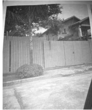
conformes en que opere un salón de eventos en una zona habitacional.

"A pesar de las quejas anteriores se les dio el permiso para operar, eso quiere decir que en el Ayuntamiento no hay coordinación y por la omisión de las autoridades, nos llevan a nosotros entre las patas porque no dormimos ya que el ruido está desde las 4 de la tarde hasta las cinco de la mañana", expresó una vecina que como otros vecinos colindantes al jardín, no están