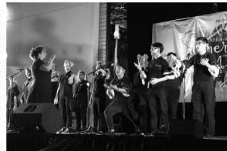
Las historias emocionantes y dramáticas que se presentan en las óperas continúan siendo relevantes en la actualidad al igual que lo eran en su momento de estreno.

Reséndiz alentó a los asistentes a disfrutar de la ópera que es una forma de arte clásica y atemporal por su innovación en la música y el teatro.