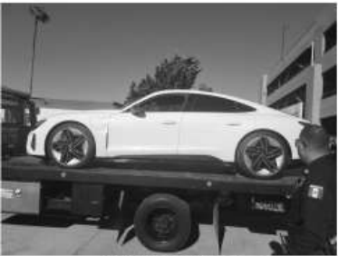
Por Delia Ruelas

Gracias al oportuno reporte del Hotel Rosarito, un vehículo robado en Estados Unidos fue recuperado la tarde del martes 29 de agosto. El vehículo habría sido rentado en San Diego y detectado por la compañía aseguradora cuando cruzó hacia México. Utilizando el sistema de localización GPS, fue posible seguir la trayectoria del conductor hasta el estacionamiento del Hotel Rosarito cuando era remolcado por una grúa de la empresa GK. Los reportes indican que el vehículo entró al estacionamiento del hotel Rosarito montado en una grúa que el mismo conductor llamó cuando ya no