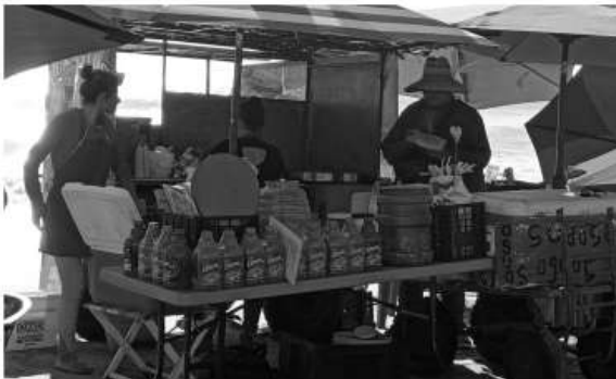
otros platillos que se preparan en la estufa usando minas de gas.

Pese a que los comercios con preparación de alimentos están prohibidos en la playa, este negocio vende abiertamente una amplia variedad de comidas, entre tortas, tacos de pescado, mariscos y