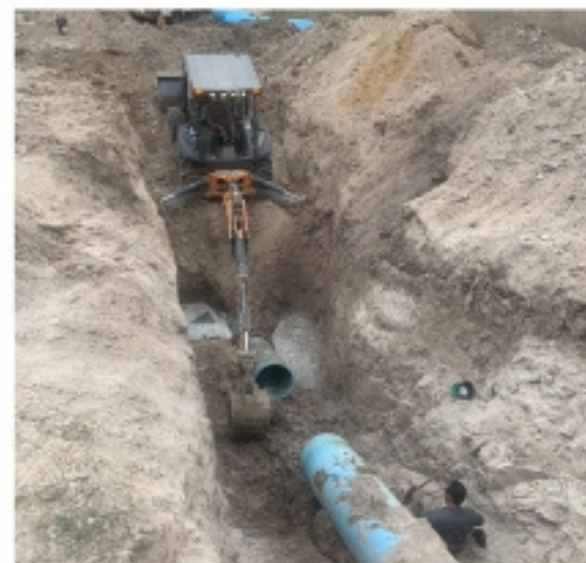
Venustiano Carranza y Rancho Reynoso.

las colonias al sur del municipio en la delegación de Primo Tapia, como Cantiles Dorados, Puerto Nuevo, Las Ventanas, Misión Viejo, Palacio del Mar, Caleta Cove, Medio Camino, Campo López, Plaza del Mar, Santa Anita, Misión Vieja San Miguel, Ladrillera, Puerta del Mar, Terrazas del Pacífico, Vista Marina, La Burrita, El Descanso,