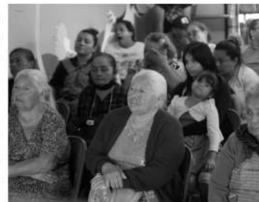
En esta ocasión los beneficiarios en Primo Tapia recibirán aves de postura.

establecimiento de un programa especial estratégico para contribuir en la generación de empleo y autoempleo de esas regiones socioeconómicas de bajos ingresos, mediante la adquisición de material vegetativo y especies pecuarias". Los apoyos son principalmente paquetes de aves de postura, ovinos y caprinos, paquetes de semillas de frutas y hortalizas de temporada y fertilizantes. El beneficiario solamente aportará mano de obra, instalaciones y el alimento complementario necesario. En esta