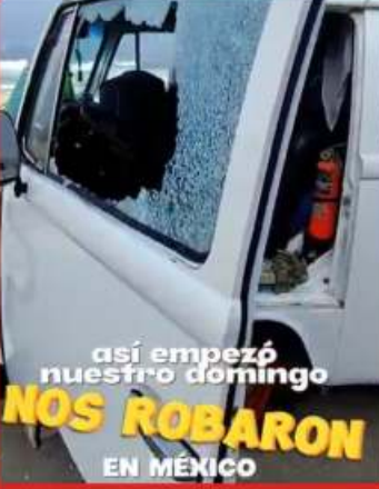
así empezó nuestro domingo NOS ROBARON EN MÉXICO

Denuncian viajeros internacionales robo, recuperan sus documentos a cambio de dinero