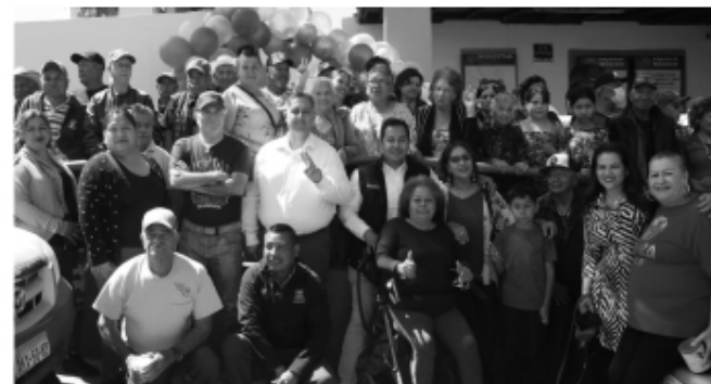
recursos municipales y bajo la colaboración de nutriólogos del DIF.

Social agregó que el Gobierno Municipal también cuenta con otros dos desayunadores en beneficio de la población, uno en la colonia Volcanes y otro en la Ampliación Plan Libertador, los cuales operan en los mismos horarios y los desayunos son implementados con