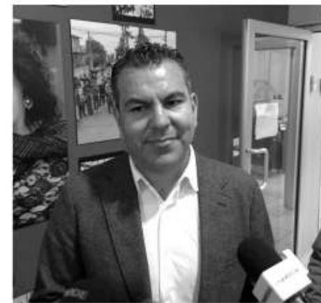
Erwin Areizaga Uribe

Mientras que las descargas de aguas residuales continúan a un lado de Quintas del Mar, el Ayuntamiento no ha acordonado la playa para evitar que bañistas ingresen a la zona contaminada. Son los Ayuntamientos los que deben de prohibir o acordonar las playas contaminadas, mientras que a la Comisión Estatal para la Protección contra Riesgos Sanitarios (COEPRIS) del Estado, le corresponde realizar muestreos para determinar el grado de contaminación y determinar si una playa es apta o no para recreación. Así lo informó el comisionado Estatal de la COEPRIS, Erwin Areizaga Uribe, tras ser cuestionado por la omisión del cierre precautorio de las playas centrales, las cuales de acuerdo con un último estudio son las más contaminadas del país. "La intención por parte de la institución que representamos es que se debería de suspender la actividad esa fue la recomendación... Por evidentes razones que la playa es administrada por el Ayuntamiento, pues le correspondería a la ciudad de cada localidad implementar en un momento dado lo que se determine en un momento de riesgo". El funcionario expresó que como miembros del "Comité de Playas Limpias" en el municipio, la Coepris, realizó y mando instalar lonas pre cautivas en la playa contaminada, especialmente a un lado de la desembocadura del arroyo Huahuatay, donde se centra gran cantidad de contaminantes que bajan