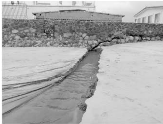
cumplido el compromiso y según vecinos de Quintas

Cabe señalar que en la última sesión del Comité de Playas Limpias que preside la alcaldesa Araceli Brown Figueredo, la CESPT anunció una inversión para rehabilitar el sistema de drenaje dañado, pero a la fecha no