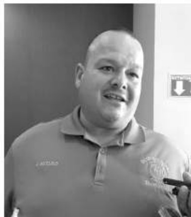
alrededores, "los incendios

Las zonas que más preocupan a la dirección de Bomberos, son Lomas Altas, Volcanes, y Rancho 40, debido a la hierba seca acumulada en sus