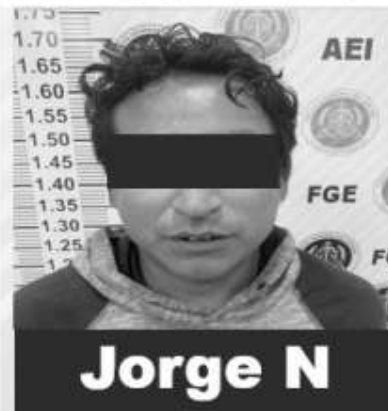
Jorge N en la investigación. La carpeta del caso establece que el 7 de abril del año en curso, siendo las

Una vez interpuesta la denuncia el 8 de abril del año en curso, la Fiscalía Especializada en Delitos Contra la Mujer por Razón de Género, a través de la Unidad de Investigación de Delitos Contra la Libertad Sexual y Familiar, procedió a recabar los datos probatorios necesarios para avanzar