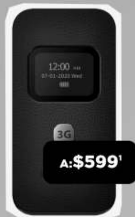
SENWA S319T FUSION