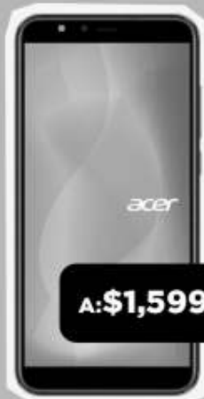
ACER SOSPIRO A60