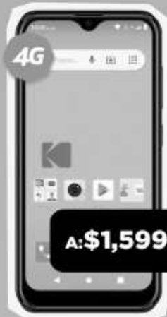
KODAK SEREN D55L