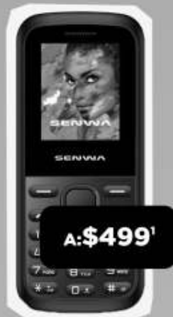
SENWA S319 STREET

WhatsApp, Facebook, Messenger, Instagram, Twitter, Snapchat + Minutos y mensajes Sin Límite ACTIVA DESDE $50 Y OBTÉN BENEFICIOS AL TRIPLE 2