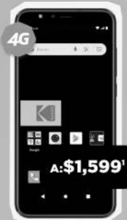
KODAK SEREN D60LX