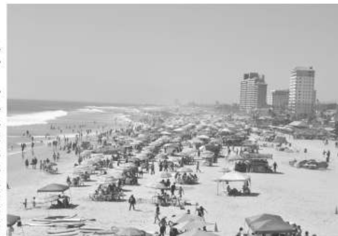
próximas semanas con el aumento de las temperaturas.

Servidores y propietarios de negocios turísticos aseguraron que el presente verano les ha dejado hasta ahora una buena impresión de recuperación económica y confían que se mantendrán excelentes números de afluencia en las