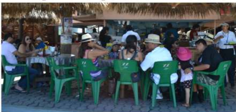
Por Delia Ruelas

Restaurantes con gran afluencia de comensales se registró durante el pasado fin de semana festivo, con motivo de la celebración de la Independencia de Estados Unidos, lo cual, superó las expectativas de la Cámara Nacional de la Industria y Alimentos Condimentados (CANIRAC).