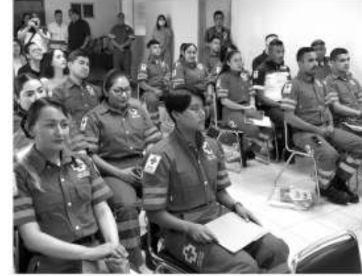
que la delegación continúa sin médico en el turno nocturno.