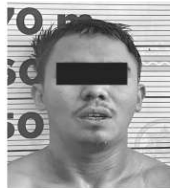
detención y lo vinculó a proceso.

En la audiencia de control de imputación de delito celebrada el día siguiente, el juez de control decreto de legal la