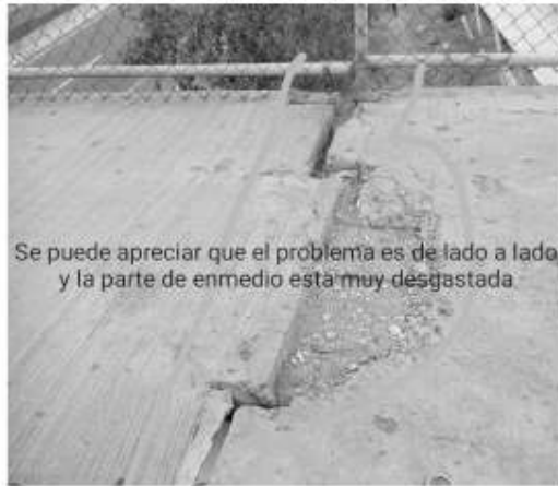
Se puede apreciar que el problema es de lado a lado y la parte de enmedio está muy desgastada

Para ello la ciudadana preocupada, anexo fotografías y descripción del deterioro, pues no es posible que solamente se pinte para embellecerlos y no se resuelva problemas serios, que pueden provocar un riesgo tanto a peatones y automovilistas.