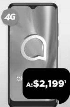
ALCATEL 1SE 64 GB