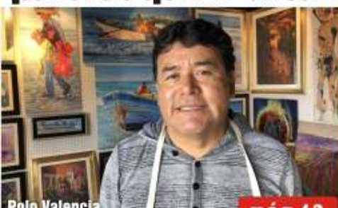
Polo Valencia pág.12