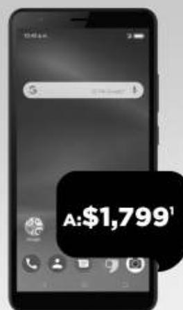
ZTE Blade L210