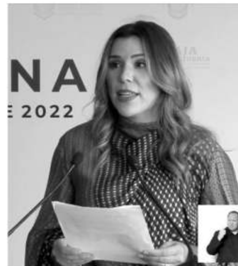
Marina del Pilar

Cabe señalar que el informe de la Auditoría Superior del Estado, señaló errores y omisiones significativos en los estados e información financiera; incumplimiento a los principios de economía, eficiencia, eficacia y las disposiciones fiscales y normativas en virtud de la falta de control en la recaudación de ingresos.