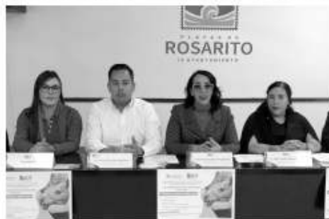
autista, trastorno por déficit de atención, y rehabilitación por accidentes, entre otras condiciones motrices.

Cada espacio contará con cuatro sesiones terapéuticas, para niños especialmente con discapacidad motriz, con síndrome de Down, con espectro