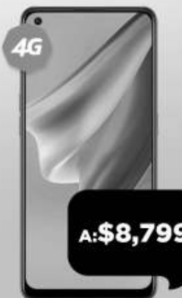
OPPO Reno 6 Lite