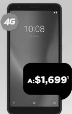
ZTE Blade A3 2020