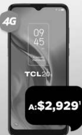
TCL 20E 64 GB