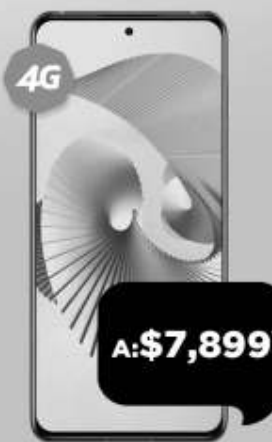
ZTE Axon 30