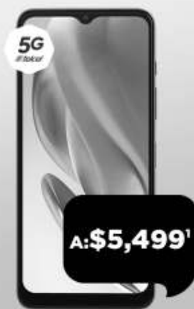
MOTOROLA g50 5G

En la compra de un Amigo Kit llévate 1 Vaso Cambia Color**