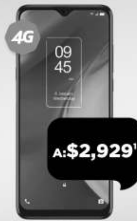
TCL 20E 64GB