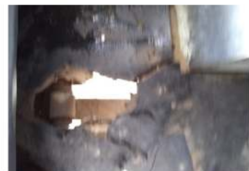
problemática antes de que sucedan tragedias.

Por otro lado, el quejoso cuestionó las revisiones mecánicas que realizan los inspectores de vialidades, pues pareciera que a esta unidad nunca la han revisado de su interior. Aunque son pocas, estima que hay otras más en condiciones similares debido al deterioro por el uso y el tiempo, de ahí la importancia de un buen mantenimiento y la modernización. El denunciante hizo un llamado a los gremios transportistas, a los propietarios de las unidades y a las autoridades, para que atiendan esta