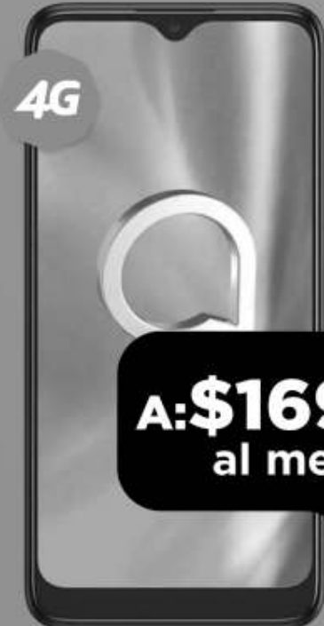
ALCATEL 5030A 64GB