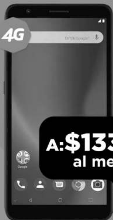
ZTE Blade A3 2020