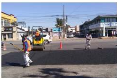
Hace unos días repararon desperfectos frente a los campos Emiliano Zapata que permanecían peligrosos debido a su mal

Con un programa de bacheo, la Dirección de Obras sigue reparando desperfectos de las principales vialidades de la ciudad y el objetivo es tenerlas listas para la Semana Santa. Después de avanzar en las calles de la colonia Constitución, Lucio Blanco y bulevar Guerrero, las brigadas se concentran ahora en el bulevar Benito Juárez reparando los baches más grandes y pronunciados.