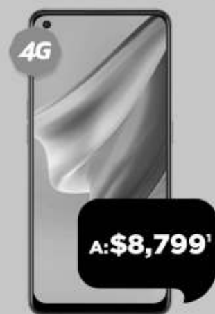
OPPO Reno 6 Lite