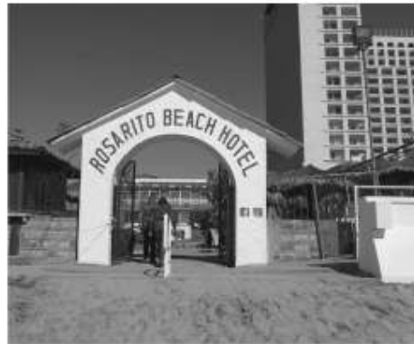
El Hotel Rosarito se prepara para recibir a los mejores voleibolistas del mundo.

El comité organizador dio a conocer que el Tour Mundial de Voleibol de Playa Elite16 Rosarito, "es el único circuito mundial de voleibol de playa en el que compiten los mejores atletas