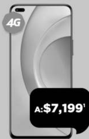
HONOR 50 Lite