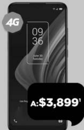
TCL 10 SE 64GB