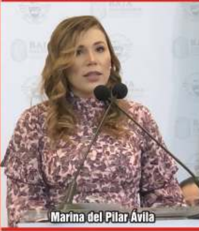
Marina del Pilar Ávila