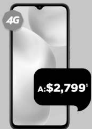
XIAOMI REDMI 9A