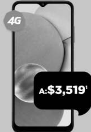
SAMSUNG Galaxy A03s