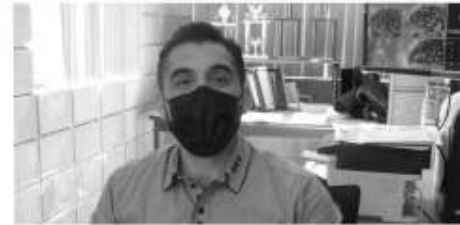
Dir. Jesús Martínez Cuevas.

Tan solo en el COBACH Reforma, existen 23 grupos en el turno matutino y 14 en el vespertino, siendo en total 37 grupos, lo que representa un mundo de