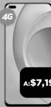
HONOR 50 Lite