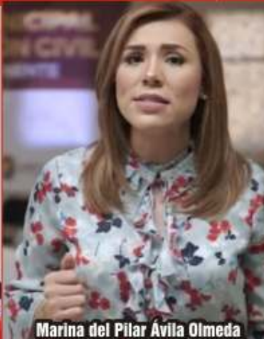
Marina del Pilar Ávila Olmeda