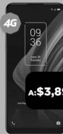
TCL 10 SE 64GB