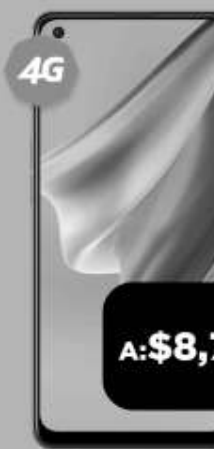
OPPO Reno 6 Lite