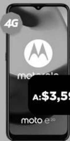
MOTOROLA E20 - 1