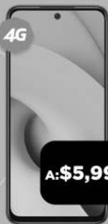
XIAOMI Redmi 10