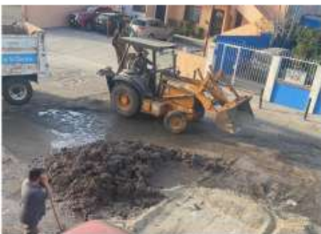
Por Delia Ruelas

Una fuga de agua potable fue reparada por personal de la Comisión Estatal de Servicios Públicos de Tijuana (CESPT) la mañana del lunes 14 de febrero, sobre la calle Rosarito en la colonia Croswaithe, sin embargo, a un costado de la fuga también había tubería de drenaje, la cual, al tratar de tapar, terminaron rompiendo la tubería provocando una fuga de aguas negras, aun así, echaron el relleno, sin importarles los escurrimientos. A pesar de que los vecinos señalaron al personal de la CESPT que provocaron con la misma maquinaria una fuga de aguas negras, el personal hizo caso omiso. Los vecinos tuvieron que soportar la tarde del lunes y el martes una fuga de agua negras además que rompieron parte de la banqueta, dejando tierra encima. Los vecinos grabaron el momento de fuga de aguas negras, así también como el personal de la CESPT echaba tierra para tapar el derrame de drenaje que ellos mismos provocaron. Por lo tanto, vecinos del lugar temen un posible hundimiento en la zona tras los escurrimientos de agua negra.