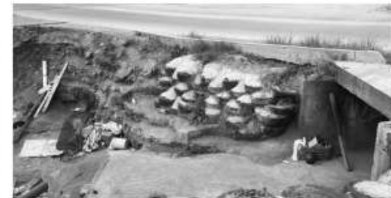
entre otros que terminan en el arroyo.

Tal como se ha registrado en el cajón pluvial y arroyo que cruza por el Centro Comunitario Cocina Central de la colonia Lucio Blanco, colindante a la calle Balbino Obeso, donde es común ver diversos desechos que acumulan indigentes como imágenes religiosas, tapetes,