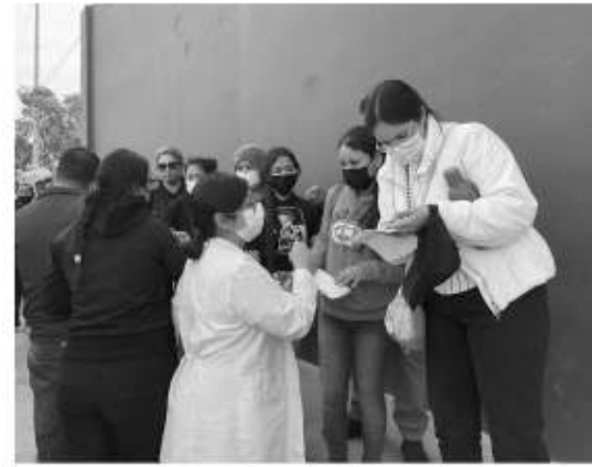
medidas preventivas, así como completar su esquema de vacunación y refuerzo.

Advirtió que no se debe de relajar las medidas preventivas como uso correcto de cubre bocas y evitar aglomeraciones pues las vacunas protegen de una infección, pero recordó que hay casos donde los pacientes infectados por Covid, poseen su cuadro completo de vacunación. Expresó que la sintomatología por el virus en una persona ya vacunada es menor que a una que no ha recibido su inmunización por lo tanto lanzó un llamado a continuar con las