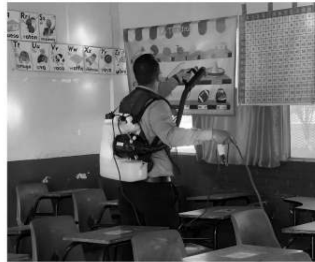
alumnos, una vez que los docentes retomen las actividades en las escuelas".

La funcionaria consideró que el paro laboral docente podría ser un factor por el cual, algunos padres no inscribieron a sus hijos, sin embargo, no es una excusa pues las clases se reanudarán, "por parte de la Secretaría de Educación continúan las mesas de trabajo con las autoridades sindicales para poder llegar a los acuerdos para la emisión del pago, hay algunas estrategias ya trazadas para rescatar esos aprendizajes en los