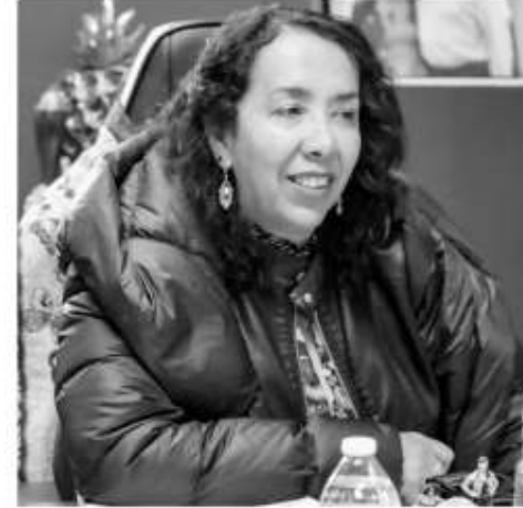
conurbados con este municipio, que tiene una problemática muy seria".

La Alcaldesa expresó que debido a la conurbación de Tijuana y Rosarito, las problemáticas de inseguridad de aquel municipio terminan afectando a la ciudad, por lo tanto la coordinación entre las diversas corporaciones es vital para abatir la delincuencia. "Es de vigilancia igual que la Policía Municipal, que también la Policía Municipal es preventiva del delito y el Ejército está coadyuvando junto con la Guardia Nacional para darle mayor seguridad a la ciudadanía, sabemos y conocemos de las problemáticas de seguridad en Baja California y sabemos que la violencia a atacado de manera frontal a Tijuana y eso nos repercute de cierta forma a Rosarito pues estamos