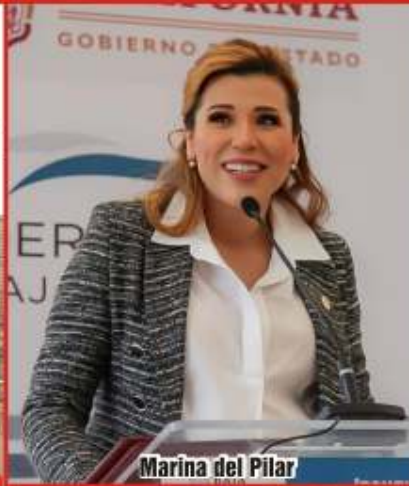
Marina del Pilar

Regreso a clases presenciales en educación básica es el 17 de enero: Marina del Pilar Ávila Olmeda