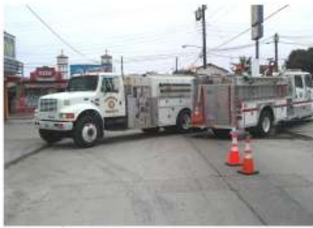
llegar a los elementos de bomberos

Una fuga de gas en la tortillería Autlán de la calle La Palma y Mar del Norte en la zona centro, provocó la movilización del cuerpo de bomberos y el cierre de varias vialidades la mañana del lunes 27 de septiembre. Un estruendo y un intenso olor a gas que se esparció a varias cuadras a la redonda, alertó a los vecinos desde muy temprano, al tiempo que vieron