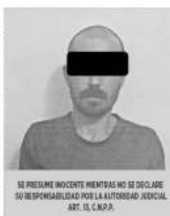
SE PRESUME INOCENTE MIENTRAS NO SE DECLARE SU RESPONSABILIDAD POR LA AUTORIDAD JUDICIAL. ART. 15, C.M.P.P.