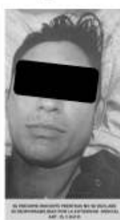
SE PRESUME INOCENTE MIENTRAS NO SE DECLARE SU RESPONSABILIDAD POR LA AUTORIDAD JUDICIAL. ART. 15, C.M.P.P.

sábado 14 de agosto a una cuadra del Palacio Municipal y de las instalaciones de la Secretaria de