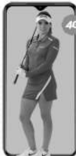
XIAOMI Redmi 9T