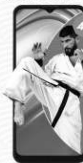
MOTOROLA Moto G20