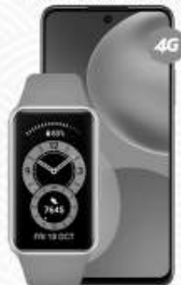
HUAWEI Y7A más HUAWEI Band 6