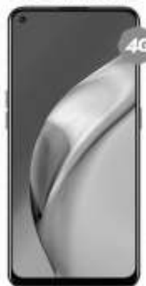
OPPO Reno 5 Lite