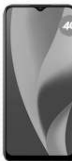
REALME C15 QE