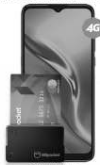
TCL 20E 64GB más Billpocket