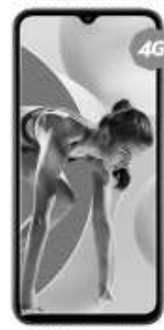
XIAOMI Redmi 9A