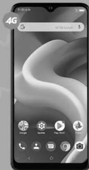
ZTE | A75 A: $3,349 1