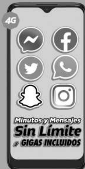
ALCATEL | 5030A 15E 64GB A: $2,999 1