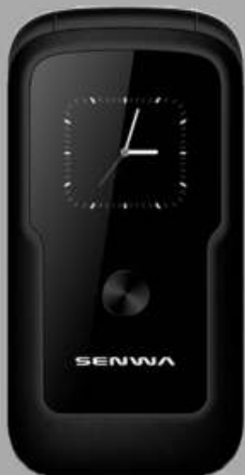
SENWA | KLICK A: $379 1