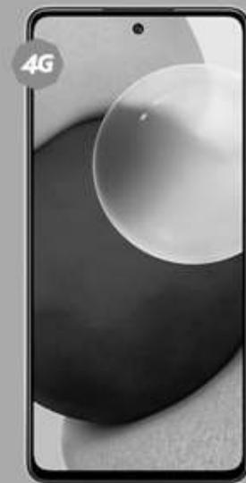
SAMSUNG | Galaxy A52 A: $8,499 1