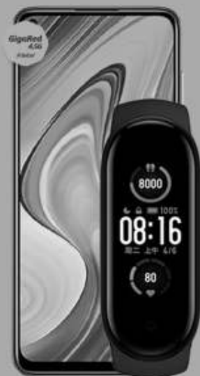
XIAOMI | Redmi Note 9 + Mi Band 5 A: $5,999 1