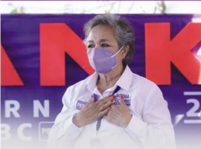
NORMA GUTIÉRREZ DIPUTADA 15 DISTRITO