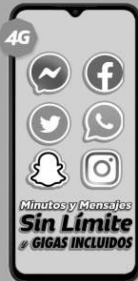
XIAOMI | Redmi 9A A: $2,799 1