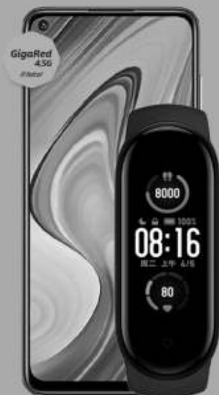
XIAOMI | Redmi Note 9 + Mi Band 5 A: $5,999 1