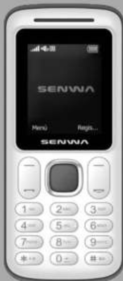
SENWA | S301 A: $349 1