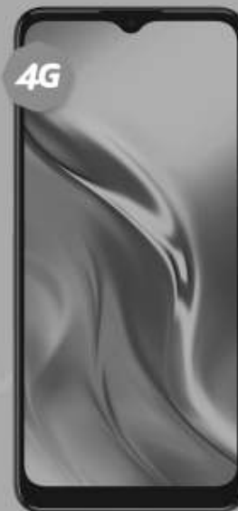
TCL | 20E 64 GB A: $3,999 1