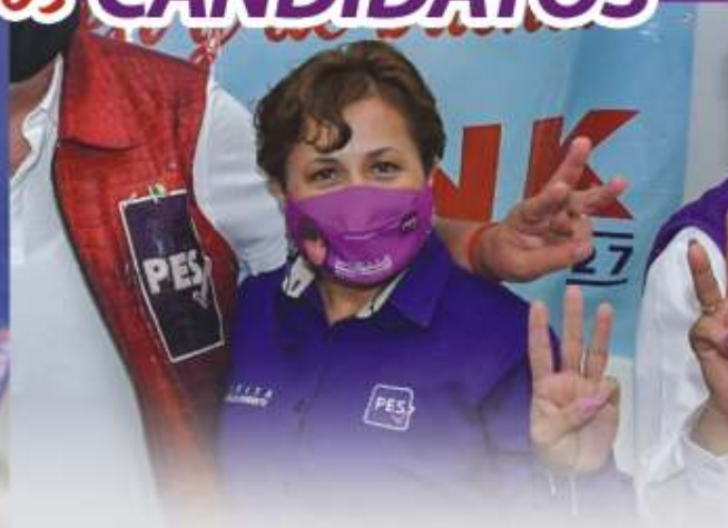
LUPITA BARRAZA DIPUTADA DISTRITO 7 FEDERAL