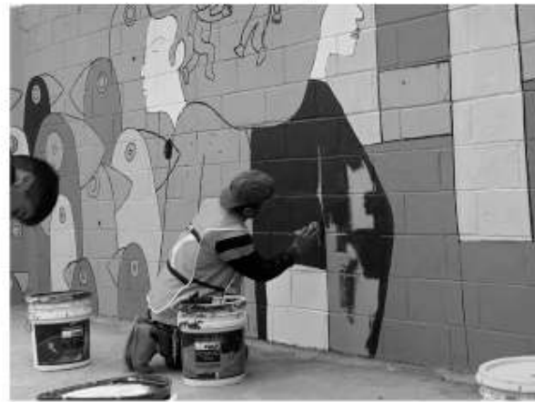
Cabe señalar que los artistas quienes pintan los

plasmar de murales a otros dieciséis parques, dando un total de veinte. El programa de mantenimiento y pintura de murales es un proyecto integral, indicó la funcionaria, pues en el parque del Plan Libertador se implementó la rehabilitación de juegos infantiles, la rehabilitación de la malla ciclónica de las canchas de fútbol, el mantenimiento al antiguo kiosco, además de limpieza y desazolve.