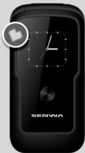
SENWA | KLICK A: $379 1