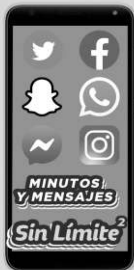
KODAK | KD50 A: $1,499 1