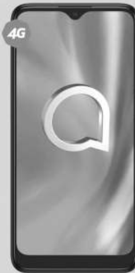
ALCATEL | 5030A 1SE 64GB A: $3,249 1