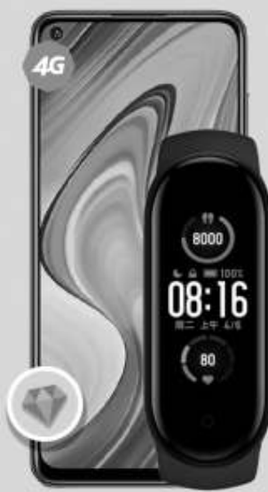
XIAOMI | Redmi Note 9 + Mi Band 5 A: $5,999 1