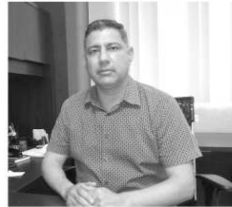
El Recaudador de Rentas del Gobierno del Estado Carlos Nafarrate Orozco.

"El último día tuvimos mucho movimiento de contribuyentes, tuvimos filas largas, pues es común que dejemos las cosas al último, pero todo salió bien y a las cinco de la tarde cerramos sin contratiempo con un incremento al doble de ingresos", concluyó.