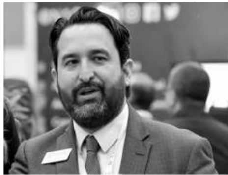
Alan Bautista Plascencia

El Presidente de la Cámara Nacional de la Industria Restaurantera y Alimentos Condimentados (CANIRAC) Alan Bautista Plascencia, hizo un llamado a los establecimientos para que no bajen la guardia y acaten los protocolos sanitarios anticovid-19 durante la Semana Santa. Tras la autorización que dio la Secretaría de Salud para que los restaurantes manejen aforos del 100% a partir del 29 de marzo y durante toda